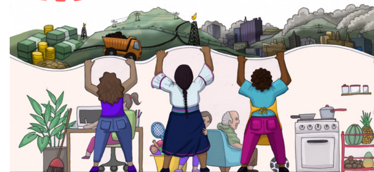
Ilustración: Angie Vanesita

IGUALANDO DERECHOS, IGUALANDO REALIDADES